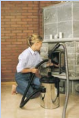
Mit Hilfe des Vorabscheiders können Sie Asche entfernen und feuchte Materialien reinigen.

■ Zum Zentralstaubsauger von Puzer gehören mehrere Zubehörteile, die das Putzen erleichtern.