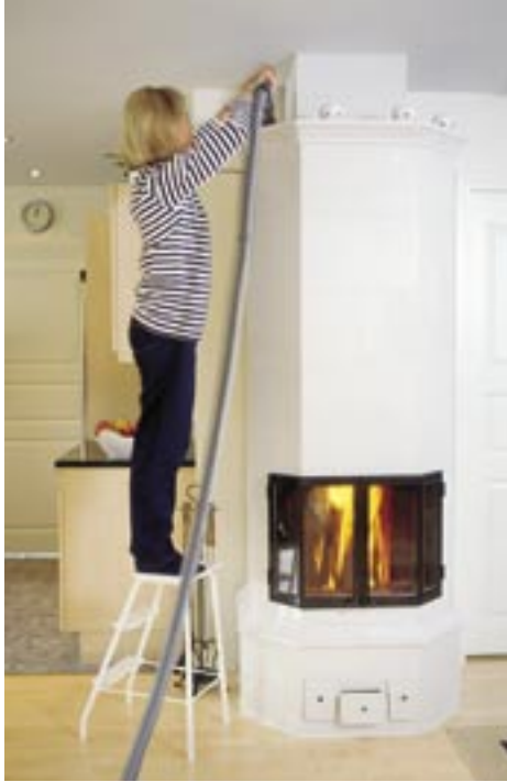
Mit Hilfe des langen Schlauchs ist es einfach, die schweren Ecken zu reinigen.

Der sogenannte Mikrostaub, der die Filtern der üblichen Staubsaugern durchdringt und zurück in den Raum kommt, wird durch die Absaugröhre des Zentralstaubsaugers direkt nach Aussen geführt. Der Zentralstaubsauger ist eine besonders gute Möglichkeit für Allergiker, aber auch für andere, die reine Raumluft zu schätzen wissen. Etwa 90% von der Zeit verbringen wir in Innenräumen. Der Zentralstaubsauger macht das Zuhause noch sauberer und angenehmer.