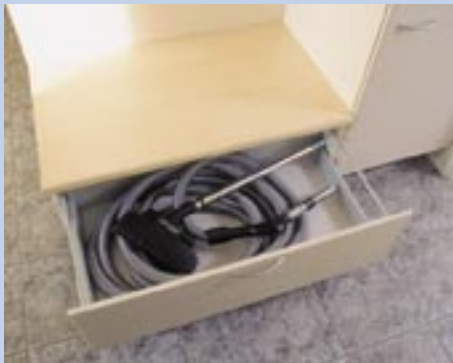
Der Schlauch kann einfach aufbewahrt und eingesetzt werden.