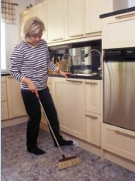
Feinsaugstecker ist ein bequemer Zubehörteil zum Beispiel in der Küche.